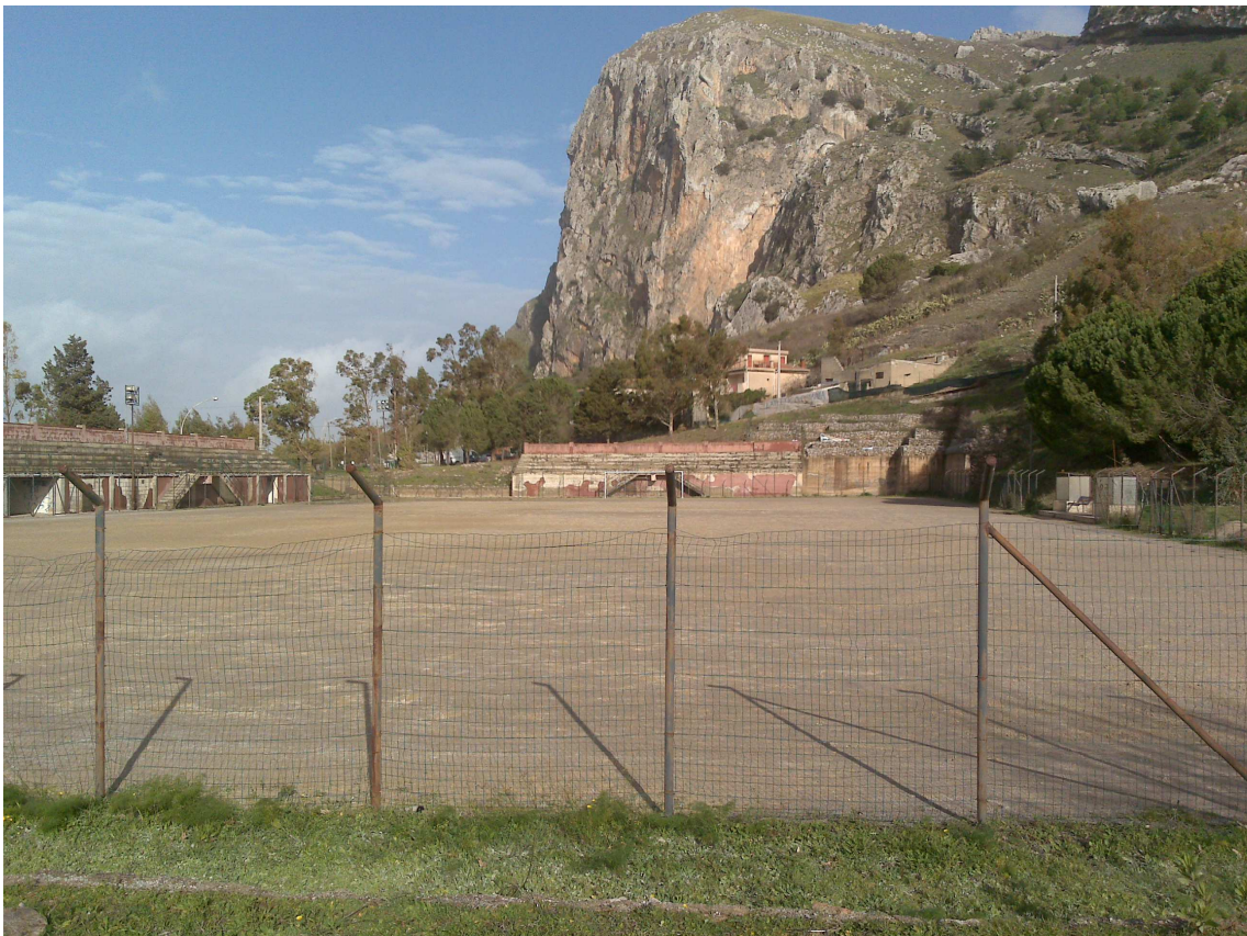
foto n. 2 - scorcio nord del campo