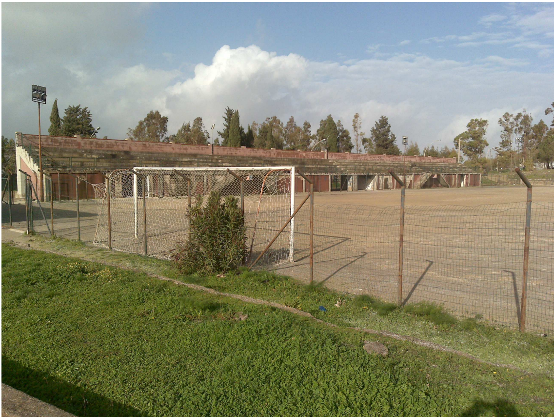
foto n. 1 - scorcio ovest del campo