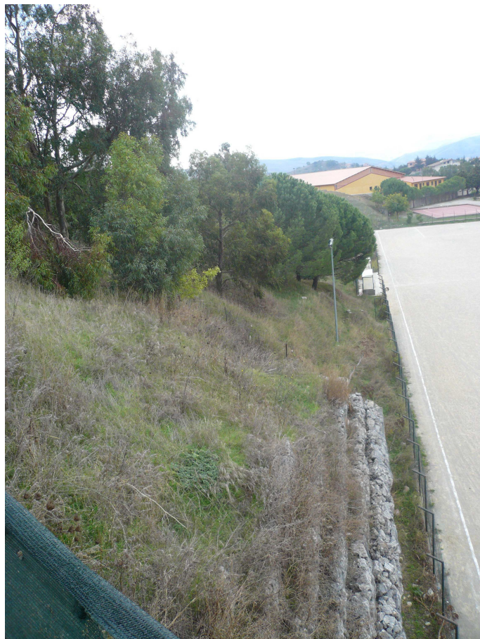
foto n. 10 - scorcio lato est del campo