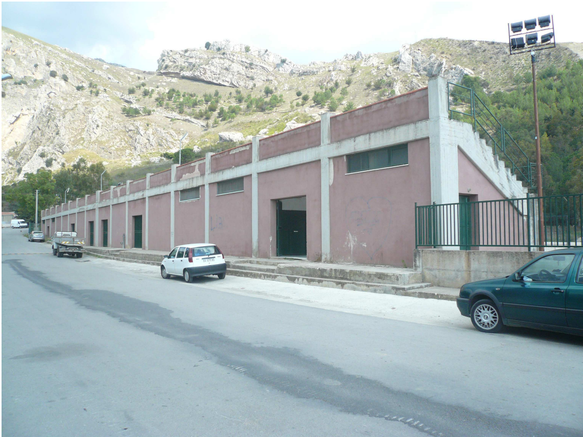
foto n. 9 - scorcio tribuna ovest da strada pubblica