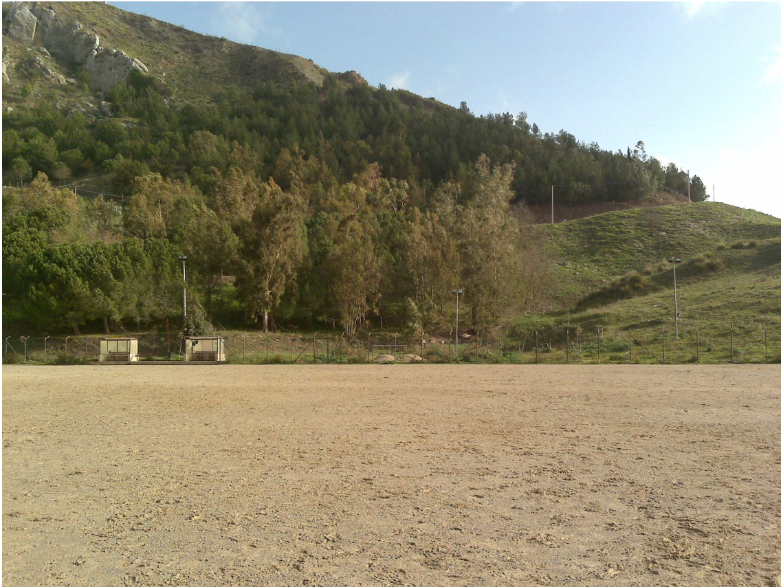
foto n. 5 - scorcio est del campo