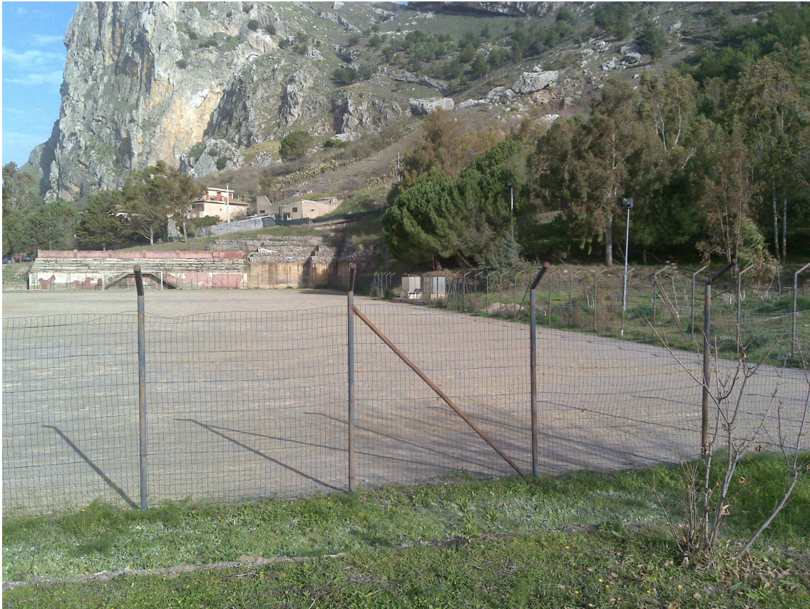
foto n. 3 - scorcio nord-est del campo