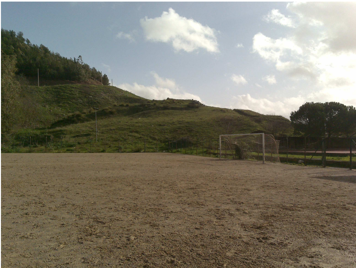
foto n. 6 - scorcio sud-est del campo