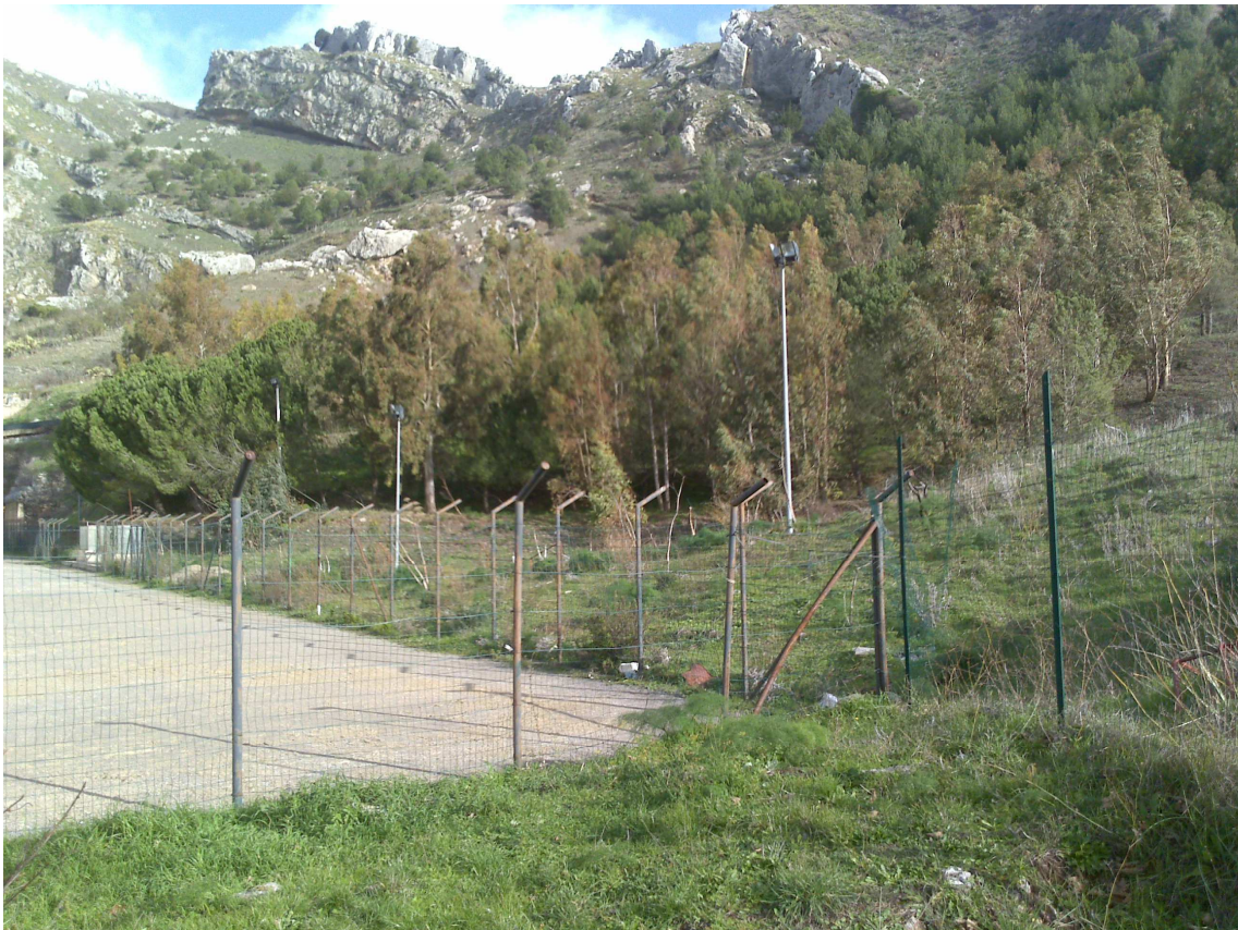
foto n. 4 - scorcio est del campo